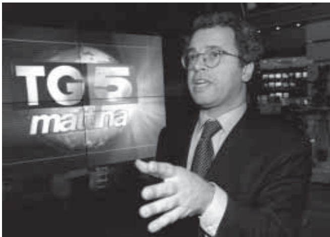
Enrico Mentana ha vinto il premio "Val di Sole" 2001

È Enrico Mentana il vincitore della sesta edizione del Premio Val di Sole per un giornalismo trasparente e dedicata quest'anno a "I successi del 2000". Il giornalista, direttore del TG 5, è sta-